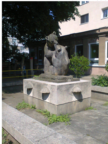
FONTÁNA - SO 01