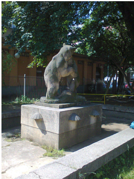
FONTÁNA - SO 02